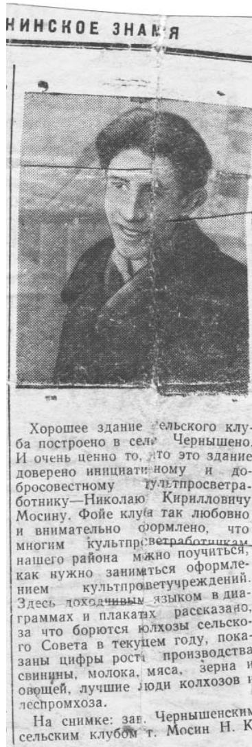
Статья о клубе с.Чернышено и его заведующем, газета «Ленинское знамя».

Слушая скорбные речи выступающих, я мысленно возвращался в Гжатск, в РДК, и вспоминал приветливую улыбку Юрия Алексеевича, его крепкое рукопожатие... «Знаете, каким он парнем был?!»... А сейчас я вспоминаю еще и свою безмятежную молодость. И частенько с ностальгией пересматриваю киножурнал «Наш край» №12 за март 1962 г.