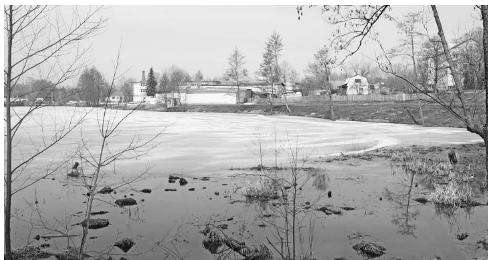
Лед на прудах сейчас тонкий. Выходить на него нельзя! На снимке - пруд Конка в Думиничах.